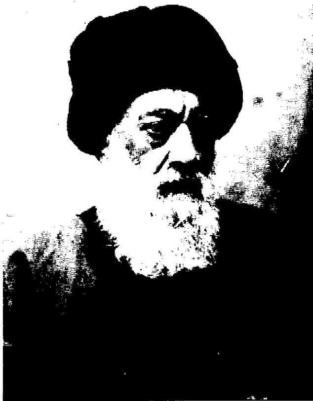
آیت الله سید محمد طباطبایی

آنچه کوشش کردند فتوای حلال بودن تنباکو را از علما بگیرند، موفق