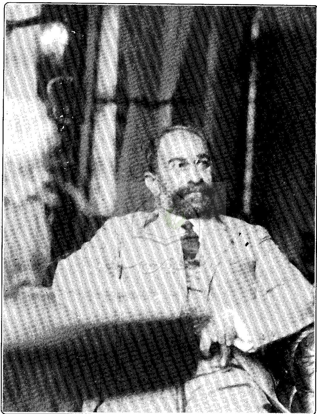
محمد علی فروغی (ذکاء الملک)