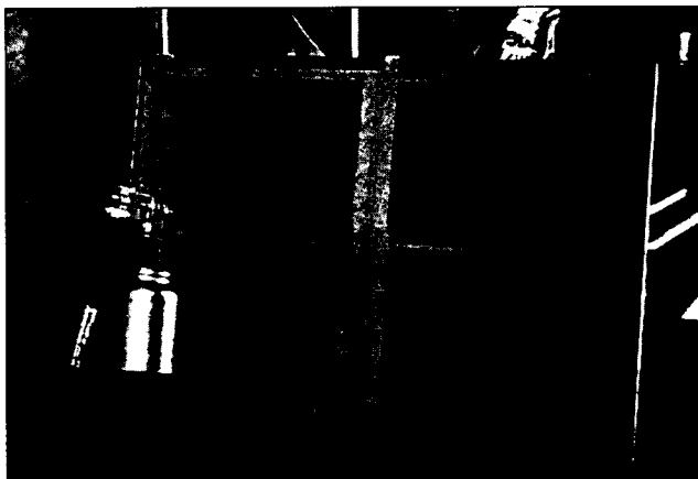
شکل شماره ۱ - افشاندن امولسیون

مقاوم ساز افشانده شده بر روی کاغذ، با وزن کردن مقدار کربنات منیزیم - که در تهیه آن مقدار عامل استفاده شده بود - تعیین گردید.