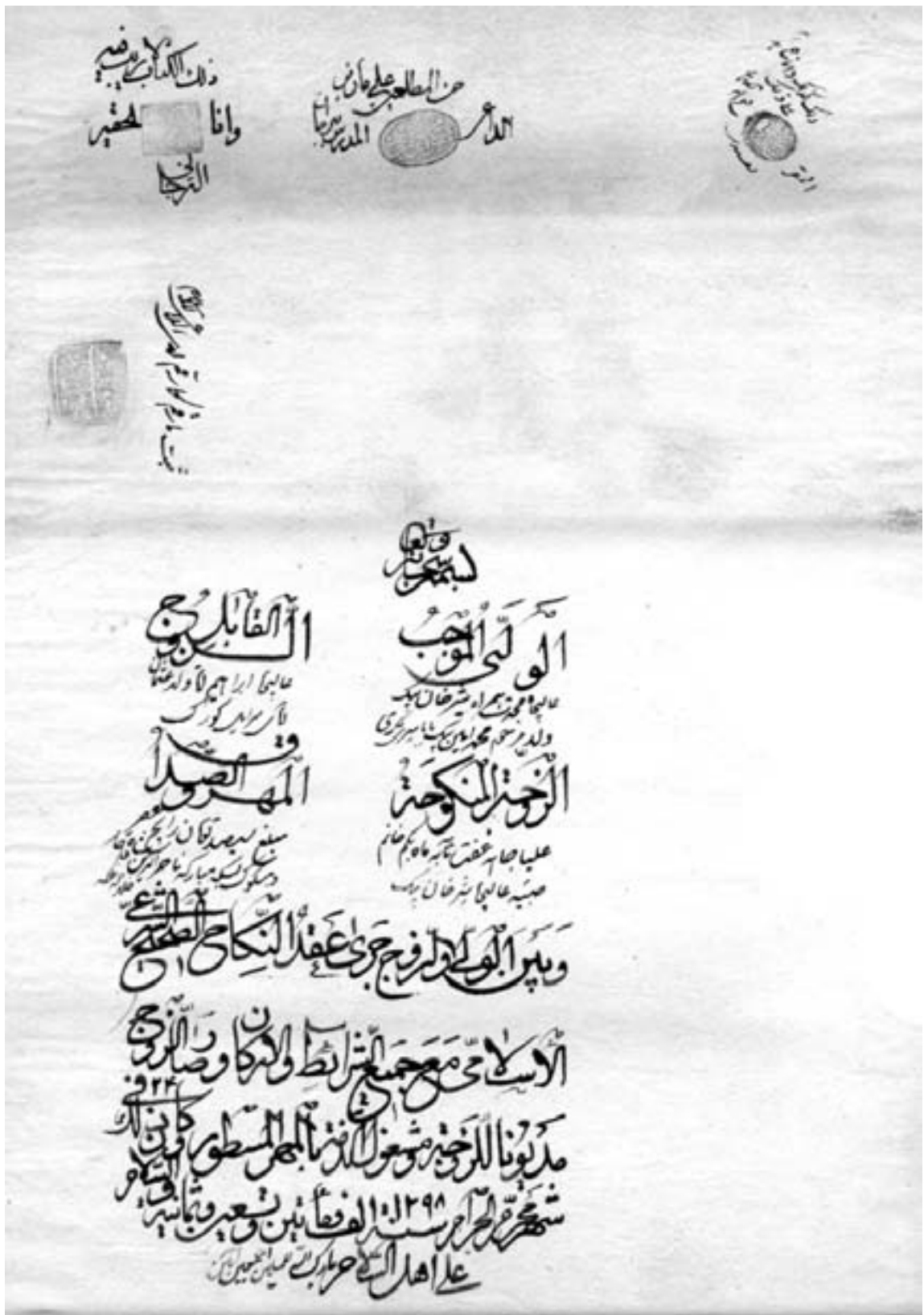
عقدنامه ازدواج ابراهیم آقا ولد عثمان آقای سرائیل گورک با ماه بگم خانم، صبیہ شیرخان بیگ (۱۲۹۸ق .)