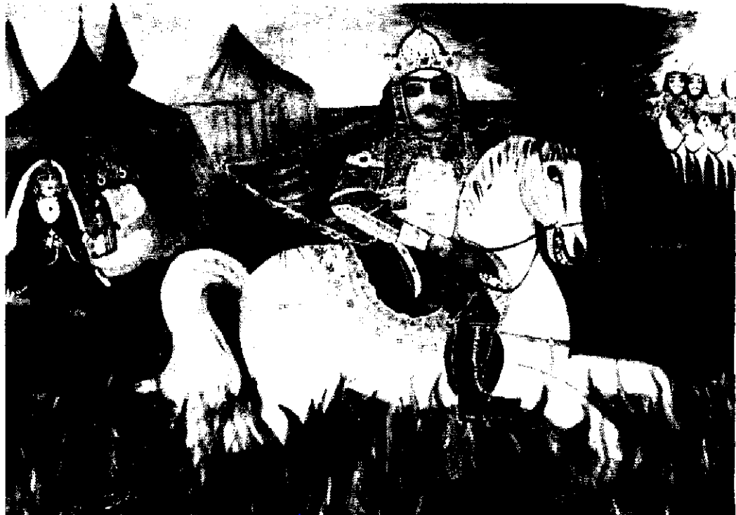
تابلوی به آتش رفتن سیاوش (با الهام از شاهنامه) - سبک فهود خانه ای بارنکهای ده هزار ساله ایران و ورق طلا - ابعاد ۱۴۱×۸۰ سانتیمتر «اثر اکرم خطیبی»