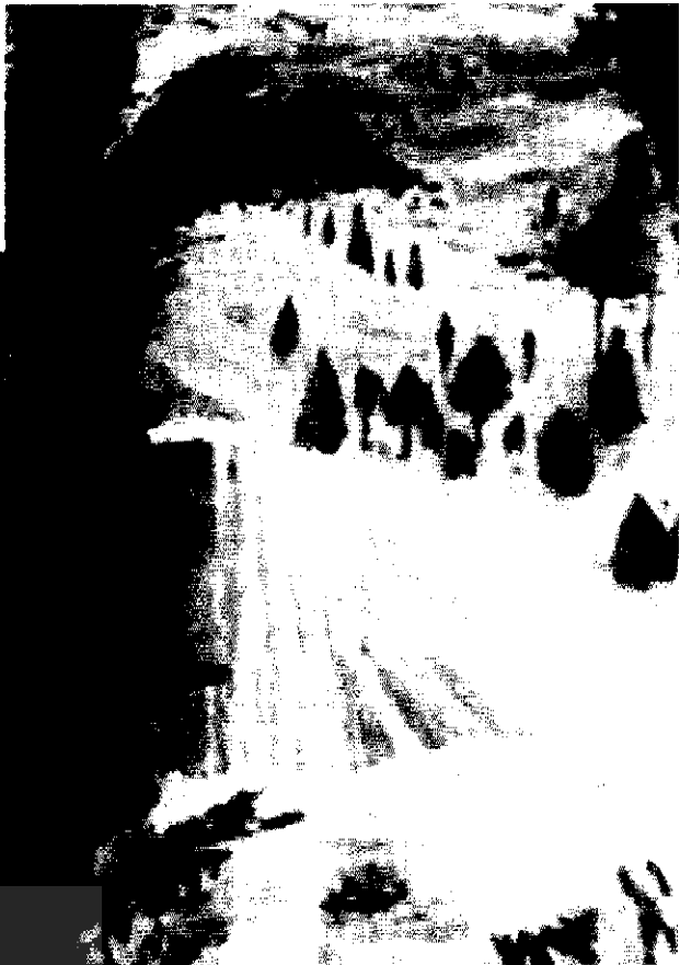
▲ تابلوی شاهنامه (کشته شدن دیو سفید بدست رستم) - تلفیق چندین سبک سنتی و مدرن با رنگ خاک و روغن و همراه با اولین و آخرین تکنیک رنگ و کلاژ (طلا - فلز - چوب - پارچه - پلاستیک) - ابعاد تابلو ۶۰ × ۲۰ + ۱۴۰ × ۶۰ سانتیمتر «اثر اکرم خطیبی»