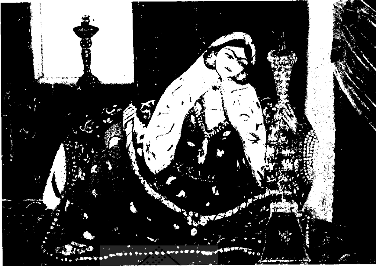
▲ تابلوی شاهزاده خانم صفوی - سبک قهوه خانه ای بارنگهای خاک ده هزار ساله و روغن و ورق طلا - ابعاد تابلو ۸۰ x ۶۰ سانتیمتر «اثر اکرم خطیبی»