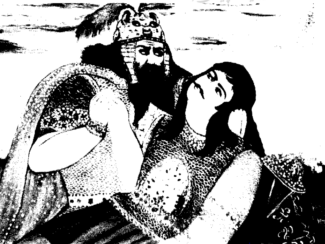
▲ تابلوی رستم و سهراب (با الهام از شاهنامه) - تلفیق اولین تکنیک رنگ (خاک) با آخرین تکنیک رنگ (پلاستیک) و کلاژ و سنتی - ابعاد ۷۰ × ۱۰۰ سانتیمتر «اثر اکرم خطیبی»