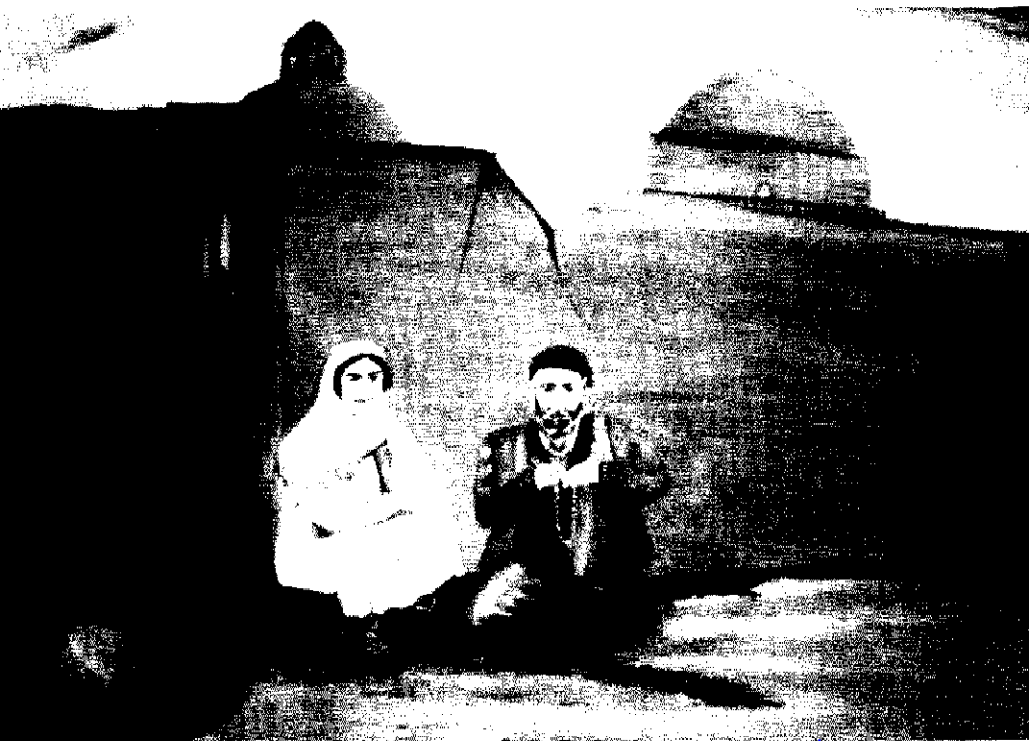
◀ تابلوی کویر - رنگ خاک ده هزار ساله و روغن اصیل ایرانی به سبک سوررئال - ابعاد تابلو ۸۰ x ۶۰ سانتیمتر «اثر اکرم خطیبی»