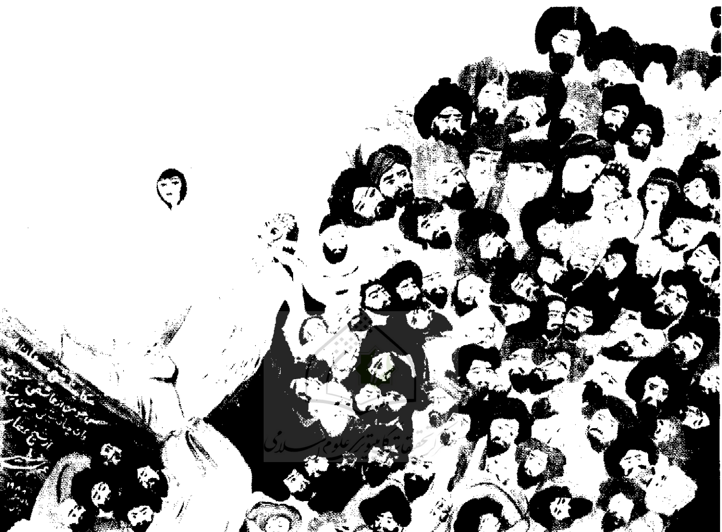
▲ تابلوی شیدایی شیخ صنعتان با دختر ترسا (الهام از شعر شیخ عطار) رنگهای شیمیایی و روغن و ورق طلا، مدرن با سبک سنتی - ابعاد تابلو ۱۰۱×۷۰ سانتیمتر «اثر اکرم خطیبی»