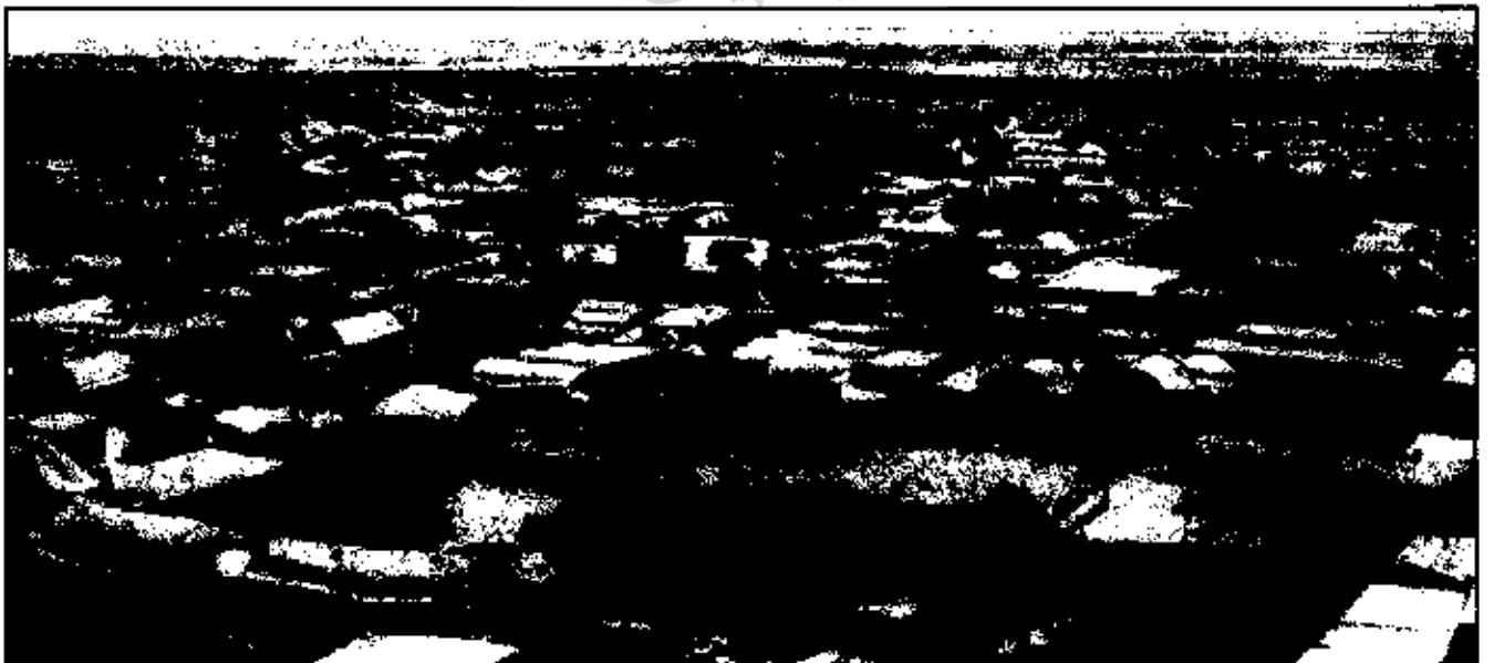
نمایی از شهر سبزوار از سمت شمال

خلاصه رانندیم، سه فرسنگ راه که آمدیم، آبادی به نظر آمد، در طرف دست چپ مشهور به پیراستیر Estar نام ده استیر است، پیری (۳۹) در آنجا دفن است، گنبدی هم داشت، رفتم آنجا به ناهار بیفتم، جائی نداشت که بتوان افتاد، آبی به قدر دو سنگ می آمد، از باغات بالای همین ده به فاصله سه میدان اسب بود، در پیراستیر ادیب الملک، طولوزون پیش از ما آمده ناهار می خورده‌اند، ادیب آمد، در کوجه باغی که ناهار خورده بودند معرفی کرد که آنجا به ناهار بیفتم، اسهانشان پهن انداخته آنجا را ضایع کرده بودند. راندم، بالاتر در صحراء دم نهر آب چادر زدند. ناهار خوردیم، معیر، امین الملک، ادیب الملک، و غیره و غیره هم بودند. هوا بسیار بسیار گرم بود. بعد از ناهار سوار اسب تکه جیران (۴۰) نازه شدم، ماشاءالله اسبی است مثل کوه، با عین الملک، زبور، صحبت کنان رفتم. ناهارگاه حرم از دور پیدا شد. من تنها راندم به ناهارگاه حرم، قدری پیش حرم ایستادم، از آنجا رفته به کالسکه نشسته، رانندیم. منار خسروچرد پیدا شد، سرداری سفید اسلامبولی پوشیده، به خسروچرد ترسیده سیهسالار (۴۱) آمد به استقبال، کلاه پوست کوتاه خراسانی در سر، کلیجه و فبای سیاه فجری در بر، گرد و خاک فراوان هم در هیأت او، عوض خود و جوشن و مغفر، در آنجا در اینجا گویان. ملاحظه شد، خیلی صحبت کردیم تا رسیدیم به اول سواره خراسانی و ترکمان مروی و ساروق [Saraq] و غیره و غیره. ایلخانی زعفرانلو امیر حسین خان،