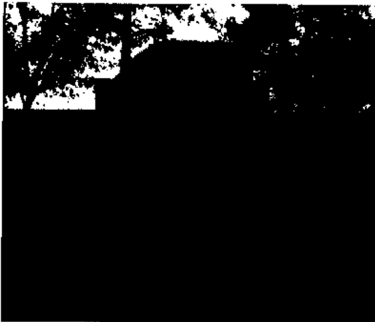
آرامگاه اسرار (حاج ملاهادی سبزواری) در شهر سبزوار

عبرت بین این بنده ضعیف البصر باشد و از آن دو خلف با شرف جناب آقا عبدالقیوم شرح ذیل را نگاهشده و مهر کرده و جناب آقا محمداسمعیل هم به خاتم شریف خود مختوم داشته و امضاء کرده اند که این همان عینک مبارک است و اینک آن عینک نزد نگارنده موجود و گرمی تر از هزار جعبه لائی منصوص است. خمس و زکات مال خود را هر سال به دست خود به سادات و ارباب استحقاق می رسانیدند و در این موقع جنس را خود وزن می کردند و نقد را خود می شمردند.