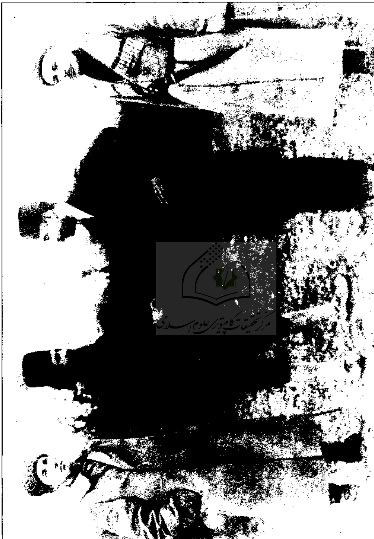
میرزا کوچک خان و نماینده اعزامی دولت مرکزی