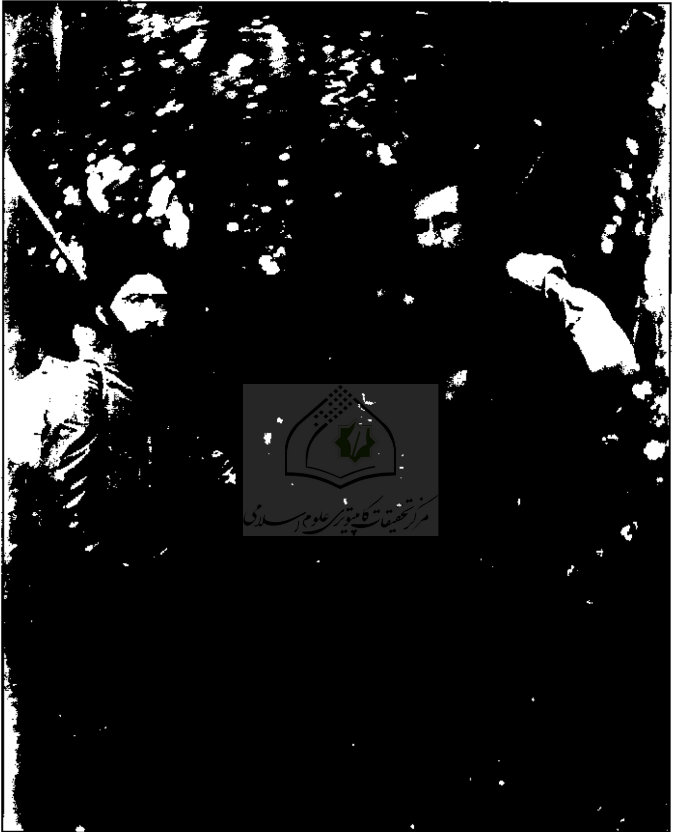
میرزا کوچک خان و دکتر حشمت