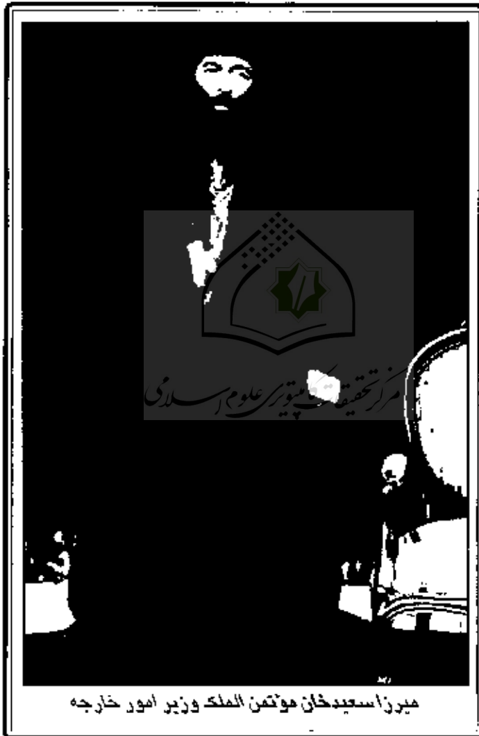
میرزا سعیدخان موتمن الملک وزیر امور خارجه

ملاحظه شد را بنویسند به نظر برسد، مامی موسم صحیح است به مهر برسد مهر کنند. پست فرامین بر روات همین مهر صحیح دربار اعظم و ملاحظه شد به خط و زوای مختار باید باشد. تا او باشد به مهر مانسب برسد. مهر باید برود عصد الملک باشد.