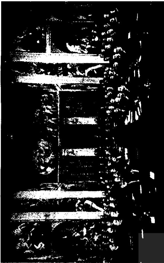
جلسه کنفرانس صلح لاهه در ۱۳۱۷ (۱۸۹۹)