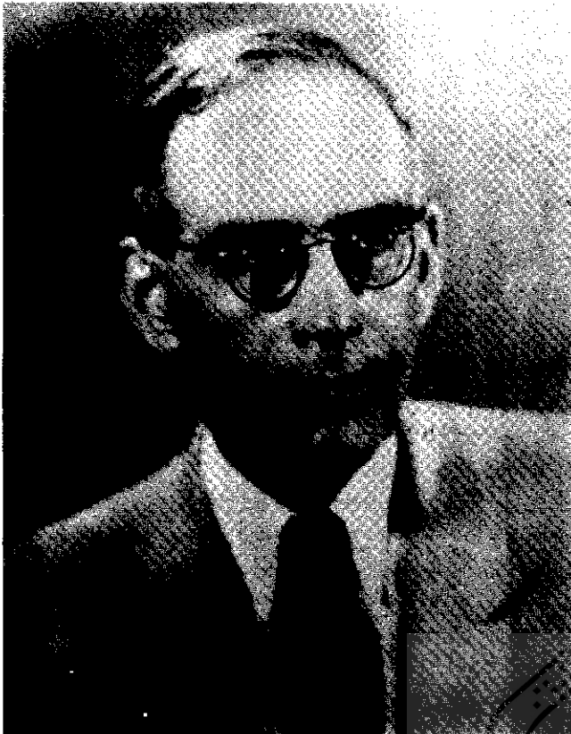
Dr. Mahmoud Hessaby Prof. Mahmoud Hessaby