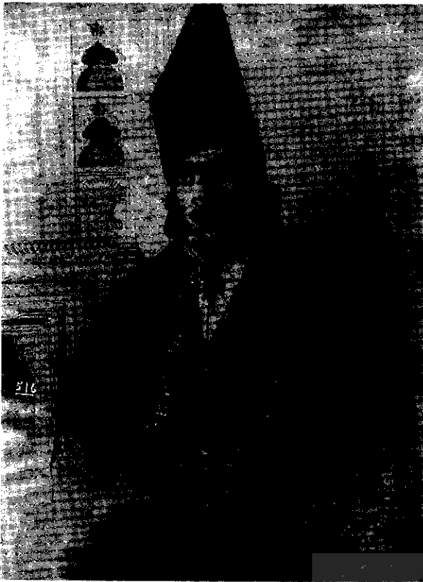
ناصرالدین شاه در عنقوان جوانی

السلطنة پیدا شد، آمد. چرند می گفت. می گفت دو نفر آدمم را فرستادم برود سر گردنه لواسان ماه ببینند.