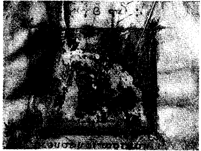
شکل ۳ - مینیاتوری از روم شرقی (قرن پانزدهم میلادی)، قبل از مرمت