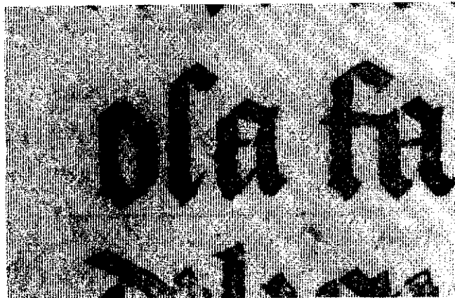
شکل ۱ - متنی با جوهر مشکى روى سطح براق يك نسخه خطى يونانى (قرن سيزدهم م)