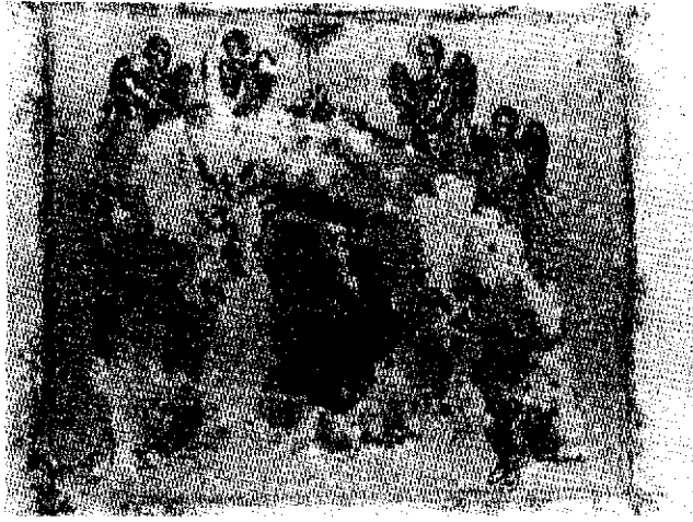
شکل ۴ - مینیاتور برجای مانده از روم شرقی (قرن پانزدهم) «آکاشینتوس» به مریم پس از مرگ، با محلول ۳ درصد آب و الکل پولیمر ترکیبی وینیل استات و اتیل