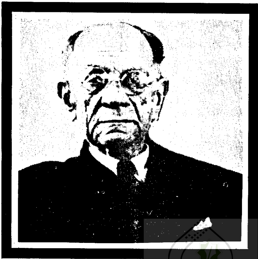
سالار فاتح در سنین پیری