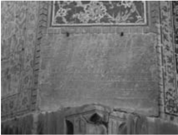
تصویر ۱- موقعیت فرمان شاه عباس بر جرز شرقی ایوان جنوبی مسجد شاه اصفهان

مطالبات دیوانیه سبکبار بوده و در مهد امن و امان آسوده فارغ البال ملهم توفیق ازلی و [...] به خاطر فیض مآثر پرتو انداخت که در ماه رمضان که ایام طاعات و عبادات است و شیعیان اهل بیت طیبین و طاهرین که سالکان مسالک حق و یقین [...] و ادای صوم و صلوات و وظائف طاعات و عبادات، قیام و اقدام نمایند که هر آینه مثوبات ۶ آن، به روزگار فرخنده آثار همایون ما عاید گردد. لهذا شمه [ای] از مراحم و الطاف [...] شیعیان ممالک محروسه فرموده، در کل قلمرو همایون، مالوجهات [...] رمضان المبارک - سوای جهاتی که به اجاره می دهند - تخفیف و تصدق مقرر فرموده، ارزانی داشتیم و این حکم همایونی، از مکمن ۷ [...] دارالسلطنه اصفهان - که مردم آنجا ابا عن جد از زمره شیعیان اند و حلقه اخلاص و بندگی این دودمان ولایت نشان بر گوش جان دارند - عز اصدار یافته، مستوفیان عظام دیوان [...] و ثبت نموده، از شوائب ۸ تغییر و تبدیل مصون و محروس دارند. وزرا و عمال و متصدیان مهمات دیوانی دارالسلطنه مذکوره، از ابتدای توشقان نیل، مالوجهات و وجوهات [...] به تخفیف و تصدق مقرر دانسته، در آن ماه مبارک - که ایام و لیالی متبرکه است - به علت حقوق دیوانی حواله و اطلاقی بر رعایا و عجزه ننموده، از حشو ۹