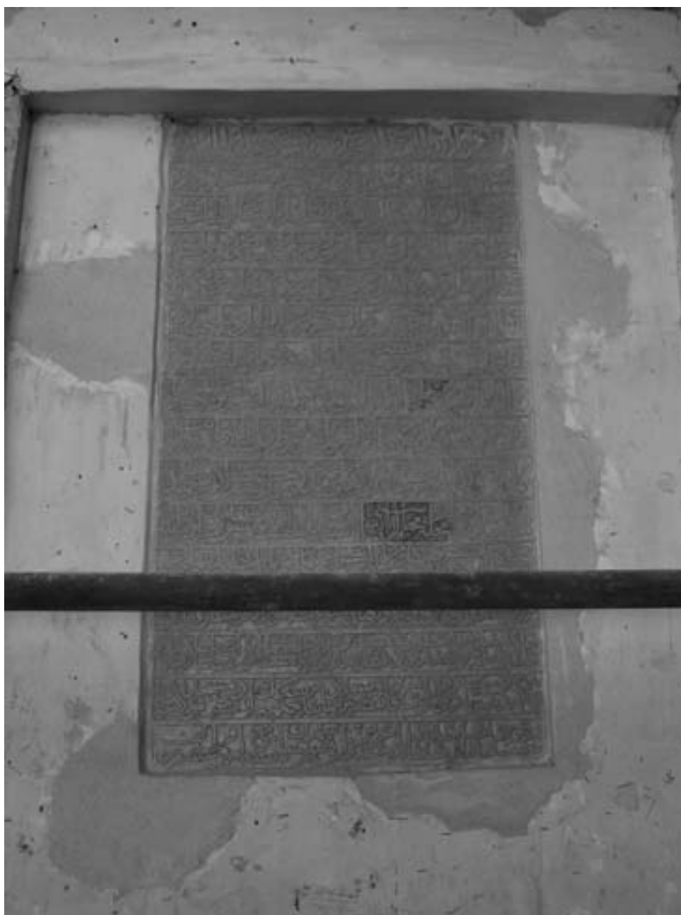
تصویر ۵- فرمان شاه عباس در مسجد جامع اردستان

شد و در آخرت در خدمت حضرت امیرالمؤمنین و امام المتقین - علیه السلام - شرمنده خواهند بود و تغییرکننده تخفیف مذکور، به لعنت الهی و نفرین حضرت رسالت پناهی گرفتار گردد و باید که دستور دوام الشرف را بر سنگ نقش نموده، بر در مسجد جامع نصب نمایند و در دعاگوئی دوام دولت قاهره، تقصیر نکنند. فی شهر شعبان سنه اربع