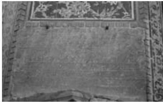
تصویر ۲- فرمان شاه عباس بر جرز شرقی ایوان جنوبی مسجد شاه اصفهان

بنیچه ۱۰ جمع هر محل وضع نمایند و [...] به رعایا نرسانیده، قلم و قدم کشیده و کوتاه دارند. سادات عظام و علمای گرام و قضات اسلام و اهالی و اعیان و ارباب و رؤسا و کدخدایان و اهل حرفت و عموم رعایای دارالسلطنه، از بلده و بلوکات، بدین عطیۀ عظاما، مبتهج ۱۱ و مسرور بوده، از روی امیدواری تمام، در لوازم دعاگوئی و دوام دولت ابد پیوند. ۱۲ (تصاویر ۱ و ۲)