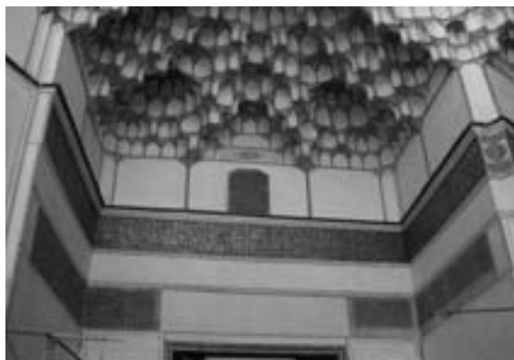
تصویر ۳- سردر مسجد میرعماد کاشان و تعدادی از کتیبه‌های فرمان‌های قراقیونلو تا صفوی

بر سردر مسجد جامع دماوند - که در میان محله قاضی و محله چریک واقع شده است ۲۱ - علاوه بر سنگی که صورت تاریخ طاعونی را به سال ۱۲۴۷ق. / ۱۸۳۲م. ثبت کرده، فرمانی از شاه عباس اول با همان تاریخ فرمان مسجد جامع اردستان یعنی ۱۰۲۴ق. / ۱۶۱۵م. نصب گردیده که موضوع آن نیز اعطای تخفیف مالیاتی به شیعیان دماوند، خوار و