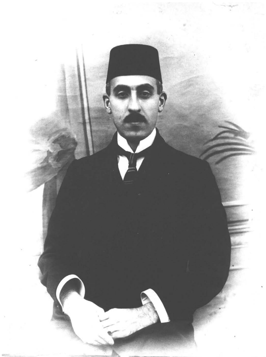
چهرهٔ دکتر محمد مصدق در جوانی

محل نگهداری عکسها: آرشیو گنجینهٔ اسناد ملی ایران