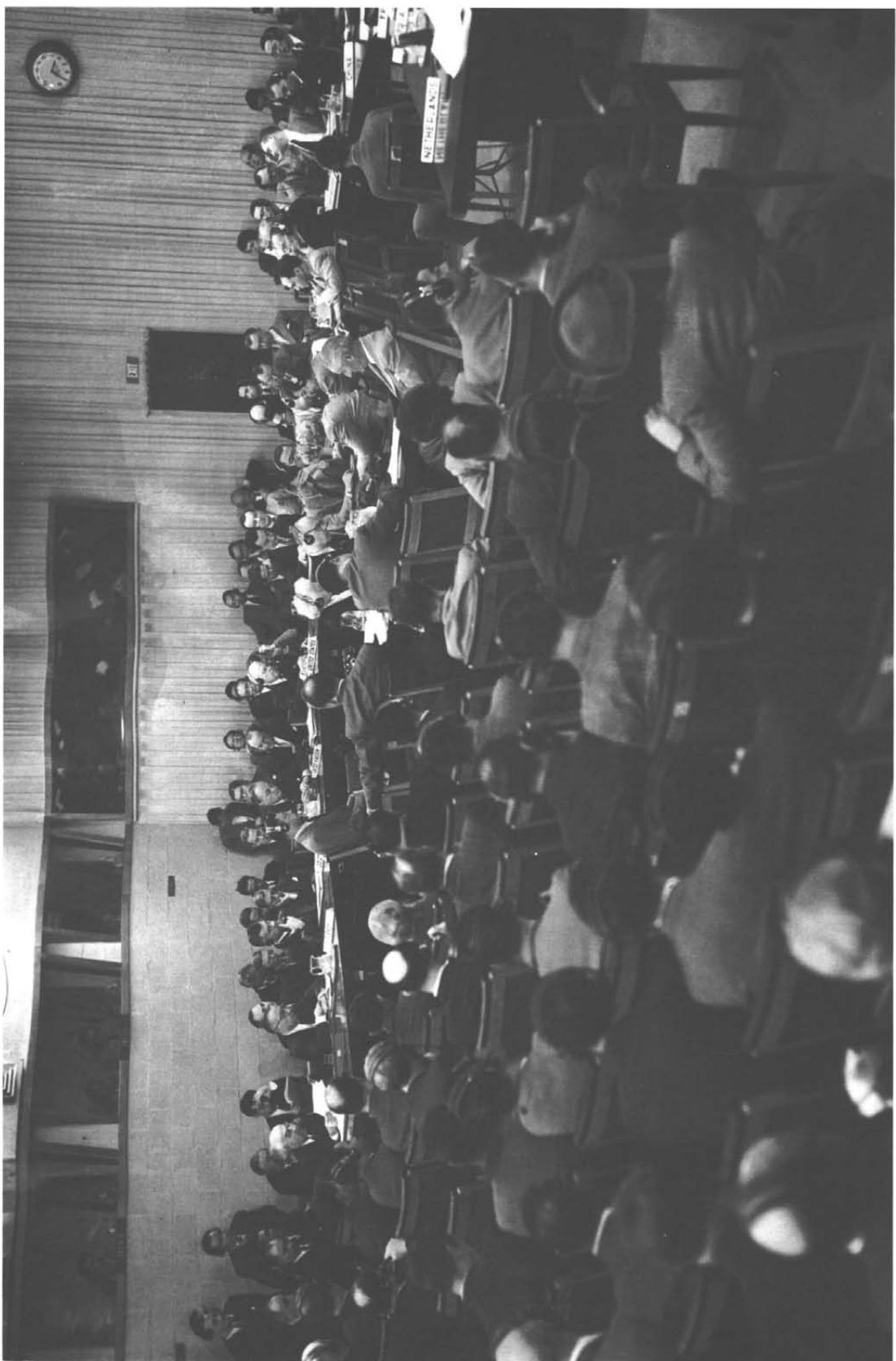
دکتر محمد مصدق در حال سخنرانی در شورای امنیت سازمان ملل متحد (گوشه سمت چپ تصویر) الهیار صالح و دکتر فاطمی هم در پشت دکتر در عکس دیده می شوند.