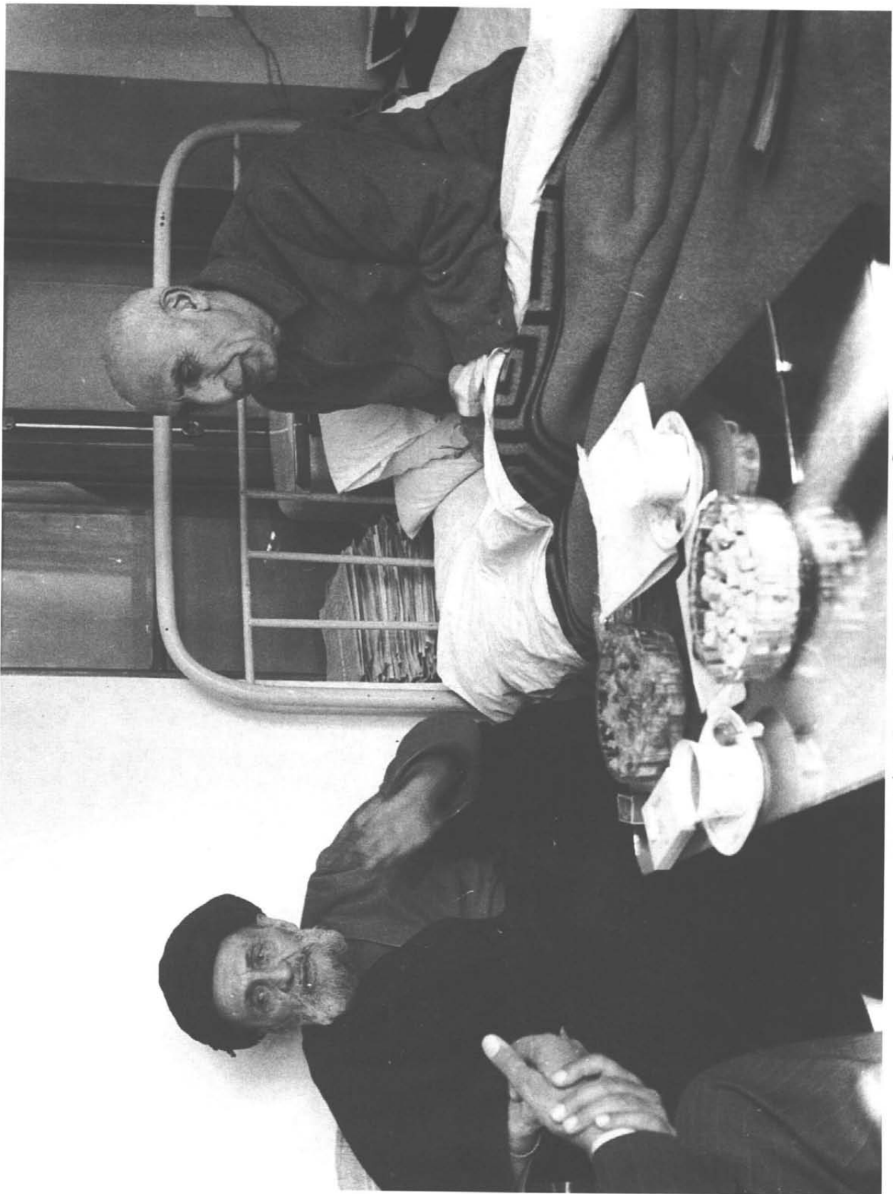
عیادت آیت الله کاشانی از دکتر مصدق در بستر بیماری