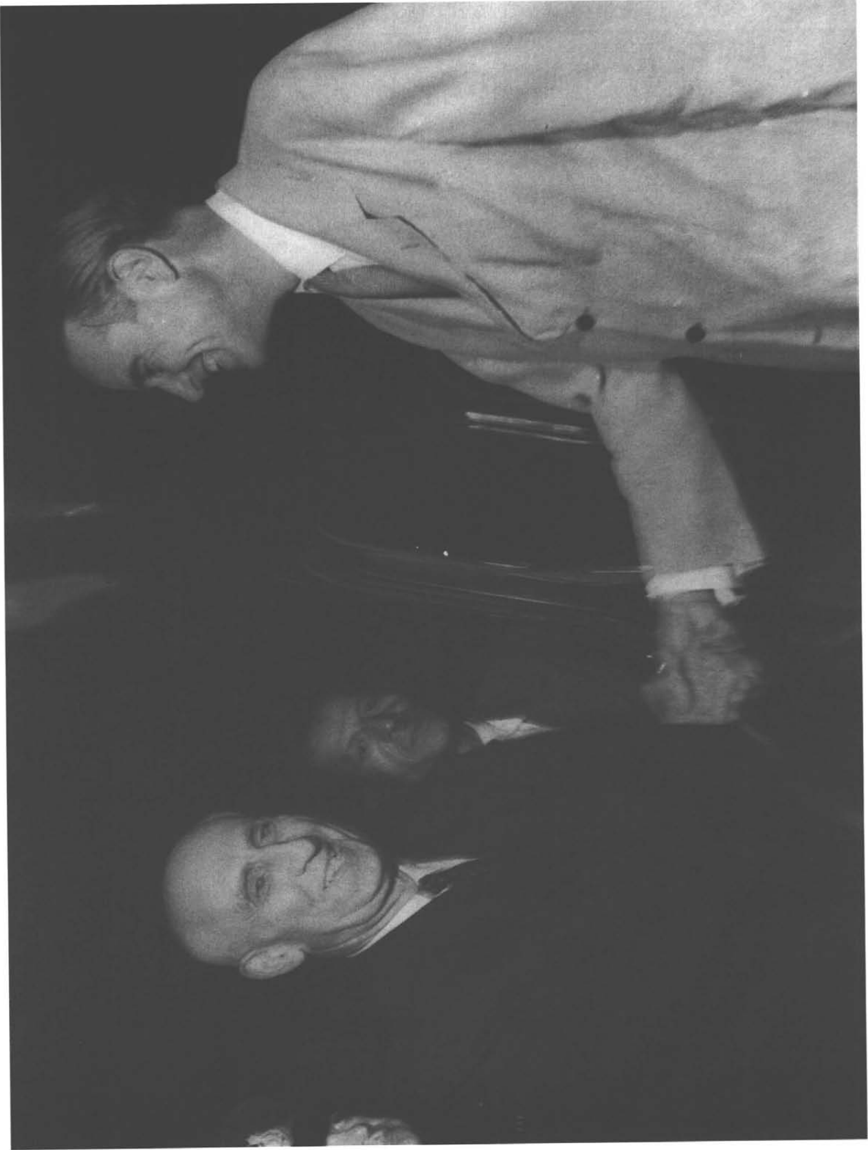
دکتر محمد مصدق و اورل ہریمین