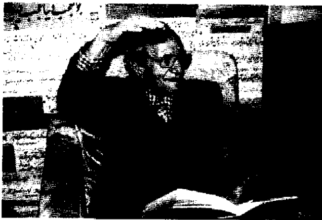
مرحوم پروفیسور غلامحسین بیگدلی (ادیب، شاعر و مورخ)