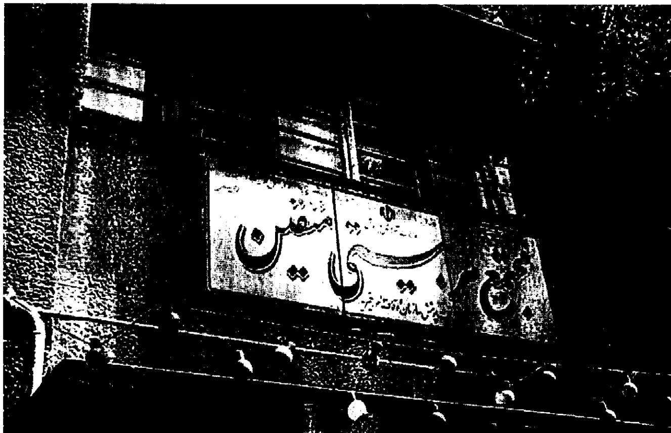
یتیم‌خانه عزیزخان خواجه (مجمع تربیتی متقین کنونی در خیابان سرهنگ سخایی)

زنده کردن املاک خود اقدام کردند. اما پس از سالها آمد و شد و شکایت و درگیری، چون ماترک سهرابزاده جزو موارد پیچیده قضایی بود، و شخص رضاشاه عملاً املاک مذکور را وقف بنگاه خیریه و هنرستان کرده و یتیمخانه‌ای در محل همان دارالایتم عزیزخان ایجاد کرده بود، و نیز وقفنامه‌ای رسمی هم در بین نبود، اداره املاک و اگذاری (۴۷) که عهده‌دار رسیدگی به این مراجعات و شکایت بود - قادر به حل و فصل منازعه موجود نگردید. سرانجام پس از چندین سال مکاتبات اداری بین مقامات عالی‌رتبه حتی نخست‌وزیر وقت، (۴۸) اداره یاد شده برای رفع اشکال و جلوگیری از ابطال وقف اموال بر هنرستان و بنگاه خیریه، پیشنهاد کرد که شاه وقت (محمدرضا پهلوی) طی یادداشتی املاک مذکور را رسماً وقف نماید تا بدین ترتیب هم وجاهت رضاشاه حفظ شده باشد، هم ورثه سهرابزاده - که دیگر با ملکی موقوفی طرف خواهند بود - از شکایت و پیگیری مطالباتشان صرف نظر نمایند.