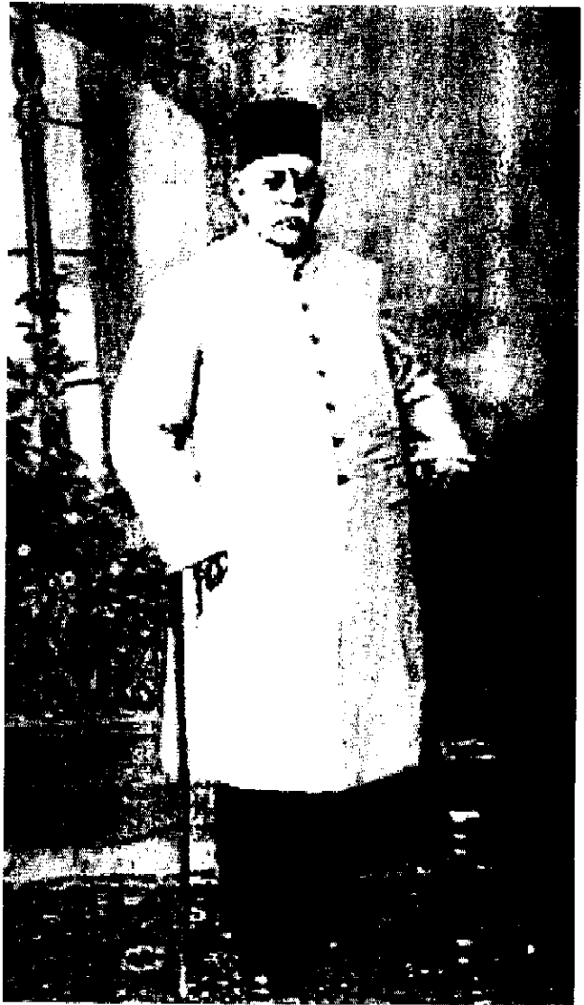
عبدالحسین میرزا فرمانفرما از نیکوکاران دوره قاجار

خیابان است. حدی شمالاً به اراضی ملکی خود حضرت والا فرمانفرما که از ورثه سید فنדרسکی خریداری فرموده و یک مقدار از آن به شرح فوق جزو محل پاستور شده؛ حدی شرقاً به اراضی ایتیمی از ورثه فنדרسکی؛ حدی غرباً به باغ اطلس ملکی خانم عزت الدوله که به دو صبیبه نظام الدین میرزا صلح کرده و به خندق شهر برای محل این مؤسسه تخصیص داد و در این مساحت بعضی از ابنیه لازمه مؤسسه مسطوره نباشد و مبلغ ده هزار تومان فوق الذکر را هم حضرت والا حسب القرار از مال خود دادند و به استحضار وزارت فواید عامه و به توسط مأمورین وزارت مزبوره به ضمیمه پانزده هزار تومان دولت به مصرف بنایی ابنیه آنجا رسید.