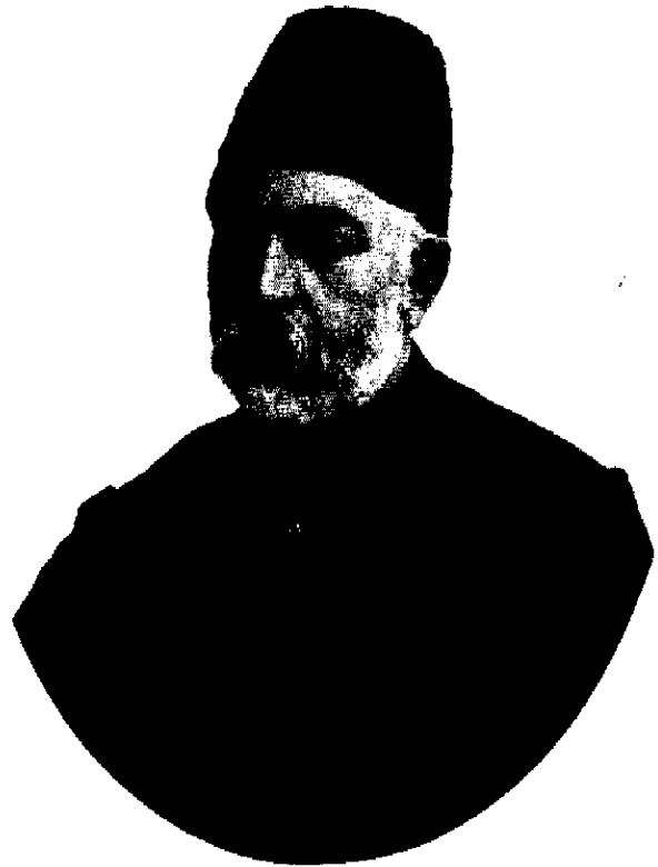
میرزا علی خان امین الدوله

ساده اخلاقی بود و قطعات منظوم بسیار آسان و همه در خور فهم دانش آموزان کلاسهای اول ابتدایی. (۹)