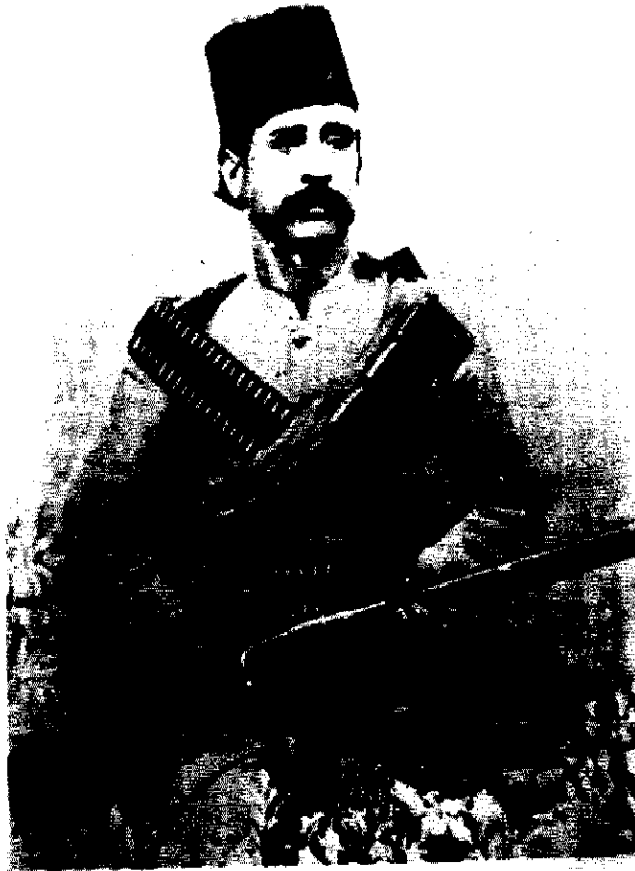
ستار خان (سردار ملی)