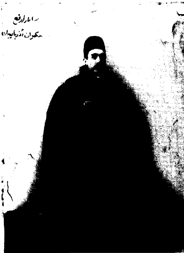
سازار رفیع حکمران آذربایجان

روز سوم، این خبر هیجانی در ملت پدید آورد. جمعیت ازدحام زیادی رو به مجلس آوردند. دستگیری و حبس رحیم خان را از مجلس می خواستند. برای اینکه این شرارت و آدمکشی پسر