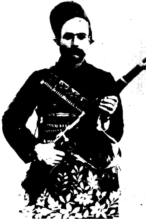
باقرخان (سالار ملی)

برای آنکه رحیم خان را دوباره به زندان باز نگردانند، یک دروغی بدینسان پراکنده گردانیدند: آن روزها چون رفته‌اند زنجیر رحیم خان را بردارند، نگذارده و گفته است: مرا "ملت" بند کرده و باید "ملت" آزاد گرداند... پس از چندی روزی هم شادروان طباطبائی، رحیم خان را همراه خود برداشته به مجلس آورد. در آن جا رحیم خان به شیرین زبانها پرداخته، به ترکی گفت: "مرا بفرستید، زبان می‌دهم که به مرز ساوجبلاغ رفته، کردان را سرکوبم. گمابندگان زود باور فریب این سخنان او را خوردند و حاجی امام جمعه خوبی - که درمیانه ترجمان می‌بود - ستایش از او کرد. سپس به رحیم خان سوگند قرآن داده، پیمان از او گرفتند که گامی به دشمنان قانون اساسی برندارد.