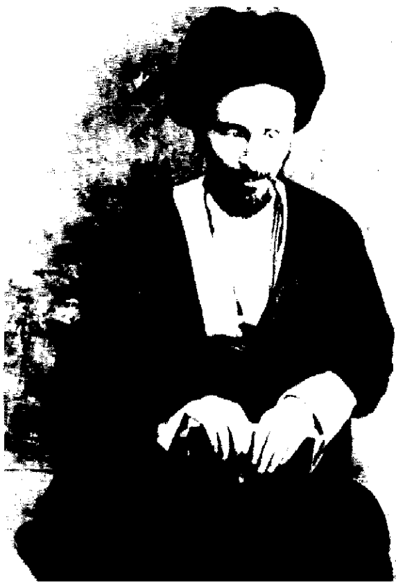
سید جمال اصفهانی