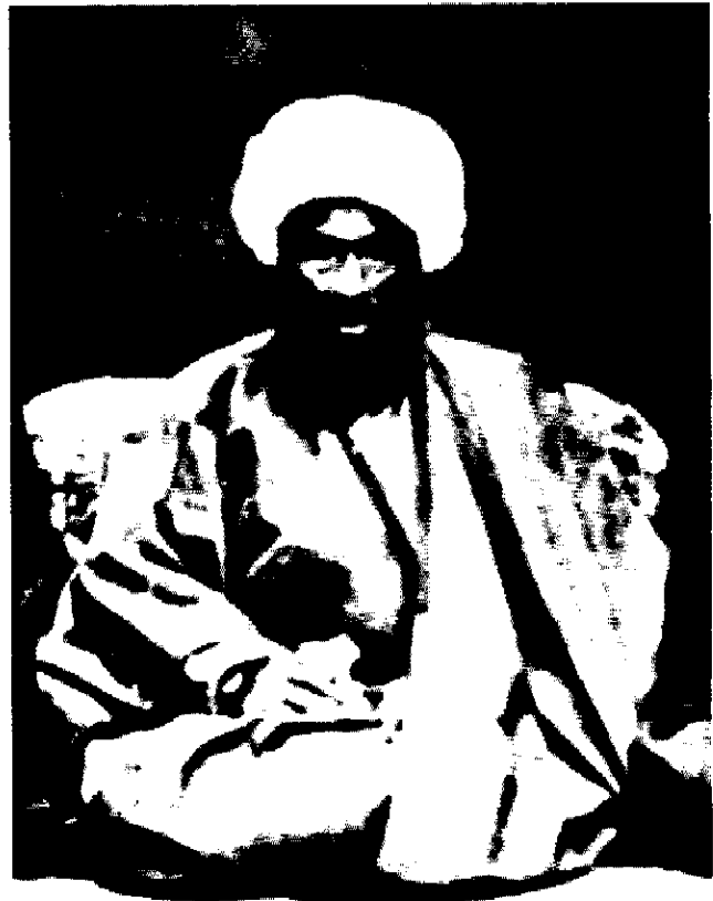
آیت الله ملا علی کنی

ناظرالاسلام کرمانی در تاریخ بیداری ایرانیان، در شرح مفصلی از سید محمد طباطبایی و اجداد و نیاکان او نوشته است: “ناصرالدین شاه از شکوه و عظمت میرزای آشتیانی در تهران