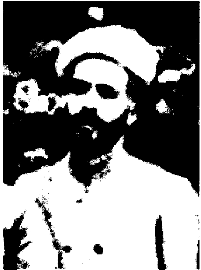
شیخ محمد خیابانی

به سه نفر فزاق می گوید؛ خیابانی در فلان خانه در زیرزمین است. فزاقها کسب تکلیف نکرده، وارد خانه می شوند. بین حیاط و زیرزمین چند تیر رد و بدل می شود. تیری به دست یک فزاق و تیری هم به پای آقای خیابانی و تیری هم به سرش می خورد و گفتند تیر سرش را خودش زده است. مرحوم خیابانی، در سن ۴۲ سالگی به دست عمال استبداد و مزدوران داخلی کشته شد.