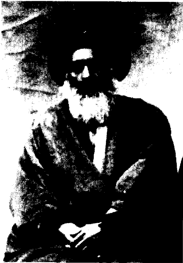
آیت الله سید عبدالله بهبهانی

زیاد، دو سید دست برادری و دوستی به هم دادند و از آن روز تا روزی که مرگ آنها را از هم جدا ساخت، در دوستی و اتفاق استوار ماندند و این اتحاد، یکی از بزرگ ترین عوامل به وجود آوردن مشروطیت در ایران شد. ناگفته نماند با اختلافی که در عقاید و روحیات طباطبایی بود، در یک اصل با هم شریک و هم عقیده بودند و آن، مخالفت با عین الدوله و دستگاه حاکمه آن روز بود. زیرا طباطبایی عقیدتاً مخالف با آن دستگاه ظلم بود و بهبهانی سیاستاً و همین اشتراک منافع یکی از عوامل مهم نزدیکی و اتحاد آن دو نفر شده.