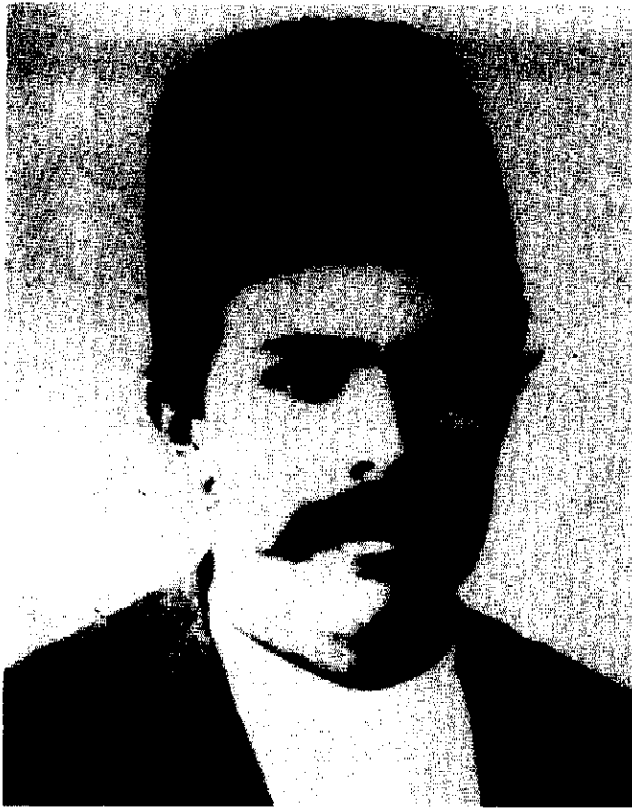
میرزا جهانگیرخان صوراسرافیل

که پادشاه ایران در ردیف امپراطوران جهان جا بگیرد و بر یک ملت متمدن و آگاه به مقتضیات زمان و مترقی و سربلند سلطنت کند و چون ترقی ملت و عظمت مملکت و سلطنت جز در لوای قانون و عدالت و بسط دانش و علم میسر نبود، برای وصول به مدارج عالیة تمدن و هم قدم شدن با کاروان علم - که دنیا را تحت نفوذ خود قرار داده بود و طولی نخواهد کشید که عالم شرق را از انوار تابناک خود روشن خواهد نمود - راهی جز برقراری حکومت مشروطه و بسط عدالت و شرکت دادن برگزیدگان مردم در تقدیرات خود نبود. ناچار همان راهی را که دنیای متمدن و ملل راقبه رفت به آن مقام شامخ و علم و تمدن و صنعت رسانده بود، پیش گرفته و این راه صواب را در مصلحت پادشاه و ملت خود تشخیص دادم و اگر راهی غیر از این اختیار کرده بودم و از نصایح درباریان بی خرد و متملقین چاپلوس که جز منافع شخصی و فریب دادن پادشاه و رسیدن به مقامات عالیه و استفاده نامشروع منظوری ندارند و در نتیجه، کار مملکت و ملک را به این پایه از مذلت و بدبختی رسانیده اند و اجانب را به مملکت مسلط نموده اند، پیروی می کردم، اول به تو که پادشاه ایران هستی و سعادت و شقاوت ایران در درجه اول به تو متوجه است، خیانت کرده بودم. سپس با دست به طرف میرزا جهانگیر خان - که با لباسهای پاره و خون آلود در کنارش ایستاده بود - اشاره کرد و گفت: این است حاصل سلطنت و فرمانفرمایی تو بر