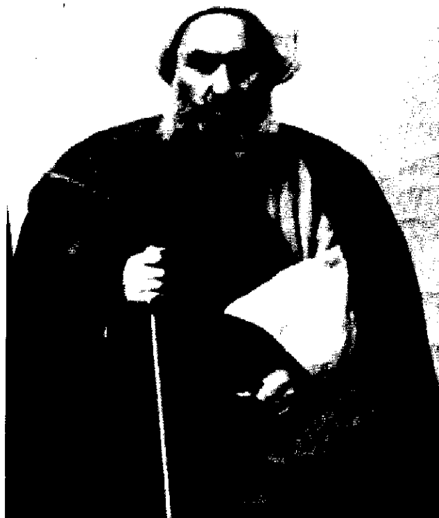
آیت الله شیخ فصل الله نوری

در آن روز محشر کبریا به پا شده بود. مجتهد بزرگ، با سر برهنه و جامه مختصر و مندرس در بین مجاهدین ارمنی و زیر چوبه دار ایستاد و زن و مرد و پیر و جوان منتظر صحنه آخرین بودند. در آن روز، تهران و سراسر ایران می لرزید.