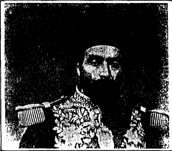
امامقلی میرزا عمادالدوله

سرانجام دولت برای اولین بار به پیشنهاد عزیزخان مکری ۳۳ مجبور به خرید گندم از روسیه گردید. سند شماره ۹ نامه ایست از عزیزخان مکری به ناصرالدین شاه در مورد مشکل نان تبریز، کمبود غله و افزایش قیمت آن، فتوای مبارزه با احتکار به منظور وحشت اهالی و راه اندازی نانوائی‌ها و لزوم مذاکره شاه با دولت روسیه و خرید غله از نواحی نخجوان. عزیزخان مکری در این نامه علت گرانی گندم را صدور غله به کشور روسیه به منظور کمک به آنها در قحطی چند سال قبل می‌داند. سند شماره ۱۰ نامه دیگر است از عزیزخان مکری در مورد چگونگی به راه اندازی نانوائی‌ها، ضبط غله محتکران و نرخ گندم. این قحطی همان طور که قبلاً اشاره شد سبب تفرقه و مهاجرت عده زیادی از مردم گردید. مهاجران بیشتر از نقاط جنوبی به نقاط شمالی که وضع بهتری داشتند رفتند و بعضی از آنها به روسیه ۳۴ عزیمت نمودند. کمبود شدید غله و بالا رفتن قیمت آن عواقب شومی را به دنبال آورد کسانی که نان نداشتند حتی از گوشت حیوانات مرده و حرام گوشت ۳۵ سد جوع می‌کردند. با پیش آمدن قحطی و مرگ و میر و تفرقه ۳۶ رعایا کشاورزی به سختی لطمه دید و تاثیر سوئی بر اقتصاد مملکت به جا گذاشت. اکثر مزارع و دهات در اثر خشکسالی