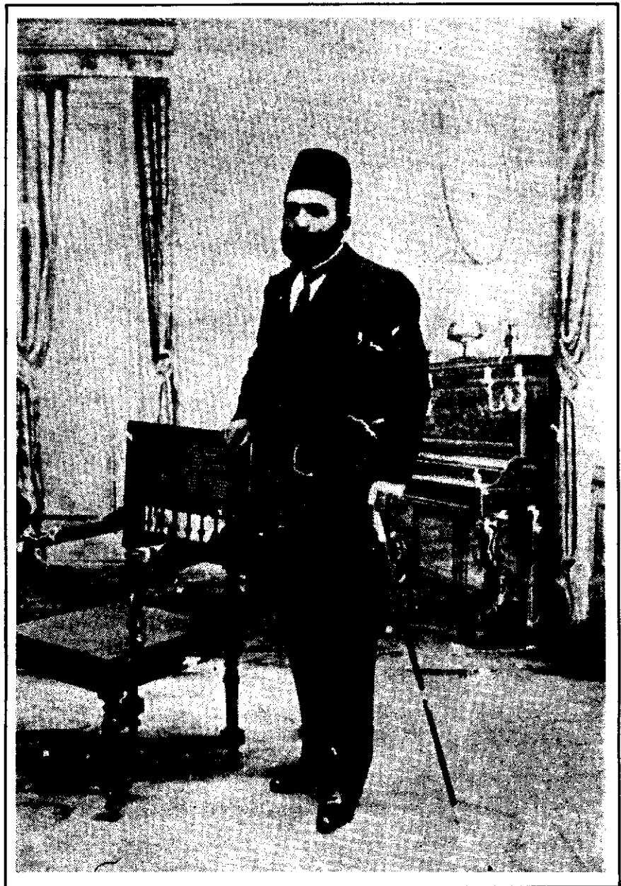
دوستعلی خان معیر الممالک

اقدس همایون روحنا فداء نرسانند یا اطلاع از امور این صفحات ندارند یا آنطور مال بینی و دوراندیشی از خدمات دیوان ندارند لهذا این کمترین بنده درگاه جهان پناه که نان و جان و آبرو و اعتبار خود و متعلقین خود را منوط به مراحم خدام آستان همایون و ازدیاد شوکت و قوت دولت ابد مدت میدانند اگر این نوع عرایض را به خاکبای همایون نکنند البته نوعی از خیانت خواهد بود در هذه السنه آثار قحط و غلا در این صفحات ظاهر است چنانکه حالا که تمام خرمنها در زمین است گندم خرواری هفت تومان