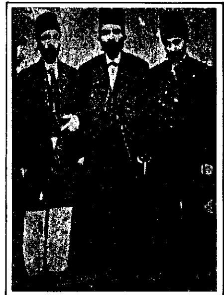
از راست به چپ: علیقلی میرزا اعضاء السلطنه، امامقلی میرزا عمادالدوله، سلطانمراد میرزا - حسام السلطنه.

در این میان شهرهایی مانند یزد، کرمان، کاشان، اصفهان و خراسان وضعیت بدتری داشتند. در مشهد از هر صد خانوار هشتاد خانوار، آن مرحوم و متفرق شدند. (سند شماره ۵) در یزد بیست هزار نفر از بین رفته و سی هزار نفر متفرق شدند (سند شماره ۶) در اصفهان روزی ده بیست ۲ نفر در معابر و بازار می مردند. در تهران نیز وضع به همین منوال بود. اجساد در گوشه و کنار خیابان مانند سنگ و کلوخ افتاده بودند، حتی بعضی از افراد نزدیک به دربار از این وضع مصون نبودند (سند شماره ۷) کثرت مزدگان و انباشته شدن آنها در گذرگاه‌ها، عدم امکان دفن و نبودن بهداشت، شیوع وبا ۳ را سبب شد. حتی بعضی از شهرها دست کم تا ۴ جمعیت خود را در این فاجعه مضاعف از دست دادند. ۳ البته وبا در شهرهای کرمانشاه، همدان، ملایر، خمسه، گیلان، سمنان، دامغان، قم، اصفهان و شیراز در سال ۱۲۸۶ نیز شایع بود. (سند شماره ۸)