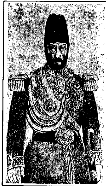
عزیزخان مگری سردار کل

اسناد بیوتات چنین برمی آید که زمینه اصلی این بلیه غیر از وجود خشکسالی های متوالی، بی کفایتی و سودجویی سردمداران وقت، خروج بی رویه گندم از کشور و عدم تصمیم گیری های مناسب و به موقع مقامات مسئول بوده که تلفاتی بسیار سنگین به جا گذاشته است.