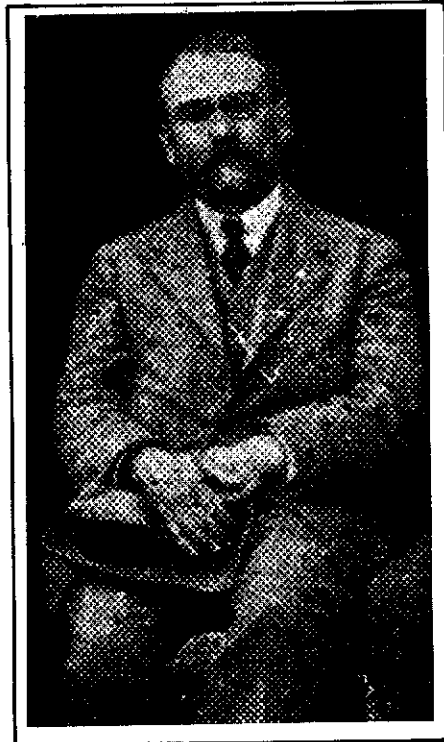
رتشتین، اولین نماینده دولت سوسیالیستی شوروی

کرد که سعی خواهد کرد که وظایف خود را با صمیمیت و عشق فوق‌العاده انجام دهد. او در پایان سخنانش از احمدشاه درخواست کرد که: «... این دولتخواه را نه فقط مثل نماینده یک مملکت دوست صمیمی تلقی فرموده، بلکه مانند یک نفر طرفدار صمیمی منافع ملل محنت‌دیده شرق منظور نظر اعتماد خسروانه خود قرار دهند».