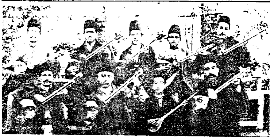
شاگردان کلاس میرزا عبدالله.

۲۹. بالالایکا (Balalatika) ساز ملی روس است. از دسته سازهای زهی - زحده ای که کاسه آن مثلثی شکل است، و دسته ای مانند دسته گیتار دارد که سیسهای بی روی آن کشیده شده که در انتهای دسته ناگوشیها کوک می شود. در دسته بالالایکا، چندین نوع از این ساز، از ریز تا بم (سوبرانو - آلتو و باس) به کار