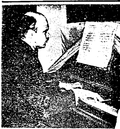
علیقوی وزیر در حال تفریح

۱۵. نگاه کنید به «بولکای درویش» که درویش خان آن را برای تار و با استفاده از مقام ماهور (به لحاظ شباهتش با گام بزرگ (Major) موسیقی اروپا) ساخته است. درویش خان سرودی هم ساخته که «موزیک ارکان کن حرب فتون» نواخته و کمپانی Pathe فرانسه ضبط کرده است، لیک در دسترس عموم نیست. بولکا (Polka) رقصی با منشاء «نوهسی» و با ضرباهنگی برنجحرک، معمولاً به وزن دوتایی (دوچهار ۴/۲) است که از اوایل سال ۱۸۳۰ در بوهم ریشه