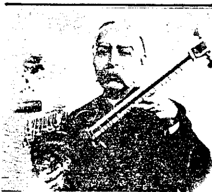
— میرزا عبدالله استاد سه تار و تار

مدل ۴ نیز فهرستی شامل ۲۸ قلم جنس ثبت شده، متعلق به سازهای موسیقی اروپایی و ملحقات آنهاست. کار سالار معزز در به کار بردن «کمان» به جای آرشه (Arco/ Bow) با همه کوچکی