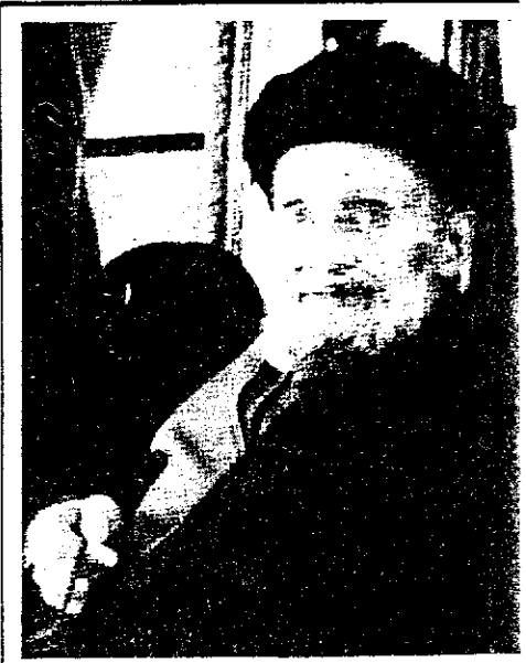
آیت الله کاشانی

روز بعد آیت الله کاشانی، محمود نریمان، دکتر بقائی و حسین مکی بازداشت شدند ۵۰ .