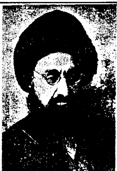
سید نورالدین مجتهد شیرازی

۶۱. سیدمحمد حسن عاملی (امین) فرزند سید عبدالکریم، معروف به امین عاملی یکی از علمای امامیه در نواحی شام و سوریه و جبل عامل در سال ۱۲۸۲ هـ. ق در جبل عامل لبنان متولد شد، پس از اتمام مقدمات علوم و سطوح در سال ۱۳۰۸ هـ. ق عازم نجف اشرف گردید و چند سال از حوزه درس آخوند خراسانی، آقای نجم آبادی، رضا همدانی، شیخ محمد طه و آقای شریعت اصفهانی بهره برد و به درجات علمی و استادی ارتقا یافت و در سال ۱۳۵۳ هـ. ق به قصد زیارت حضرت ثامن الائمه به مشهد عزیمت کرد و سپس به دیار خود برگشت و در سال ۱۳۷۱ هـ. ق در شهر دمشق درگذشت. مهمترین اثر وی دوره کتاب اعیان الشیعه است.