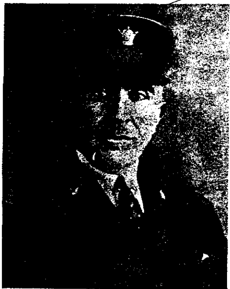
محمدولی اسدی (نایب التولیه آستان قدس)

جهت مدنی تبعید شدند و متجاوز از سی سال در حوزه به تدریس فقه و اصول پرداخت و بعد از فوت مرحوم حائری و نائینی زعمات و مرجعیت تشیع با ایشان بود و سرانجام در ششم ذیحجه سال ۱۳۶۵ هـ. ق [ ۱۶ آبان ۱۳۲۵ هـ. ش ] درگذشت و در کنار صحن حضرت علی (ع) دفن گردید.