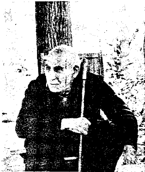
دکتر محمد مصدق

شوند، خود آقای معزی الیه شرحی به دربار عرضه داشته اگر اندک توجیهی بفرمایید مؤثر خواهد بود.