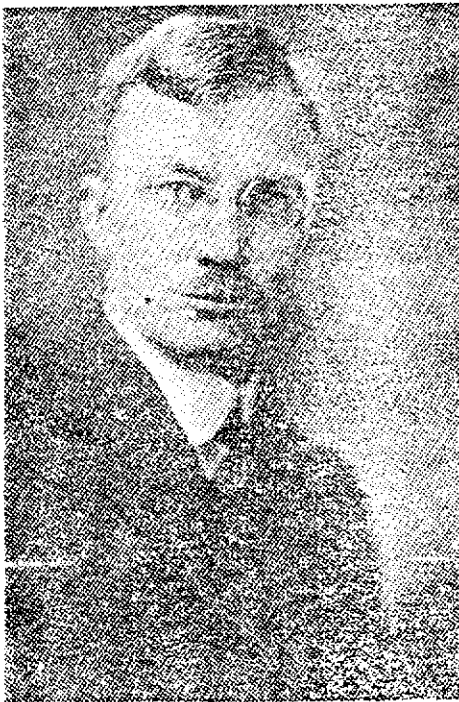
دکتر میلیسپو در مأموریت اول خود

البته فقط روسها نبودند، بلکه انگلیسها نیز همین سوء استفاده‌ها را می‌کردند. ۲۱