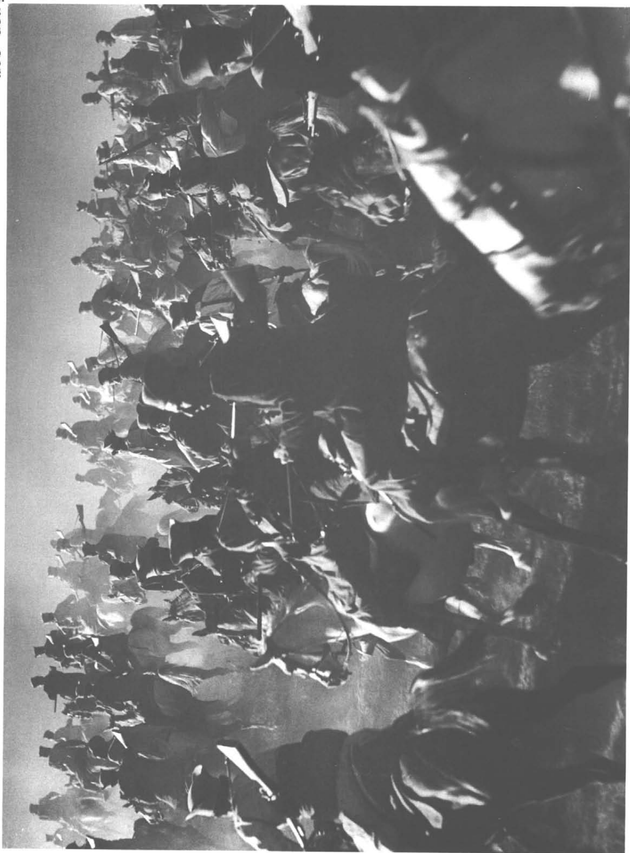
تفنگداران قشقایی - تابستان ۱۹۳۶ میلادی