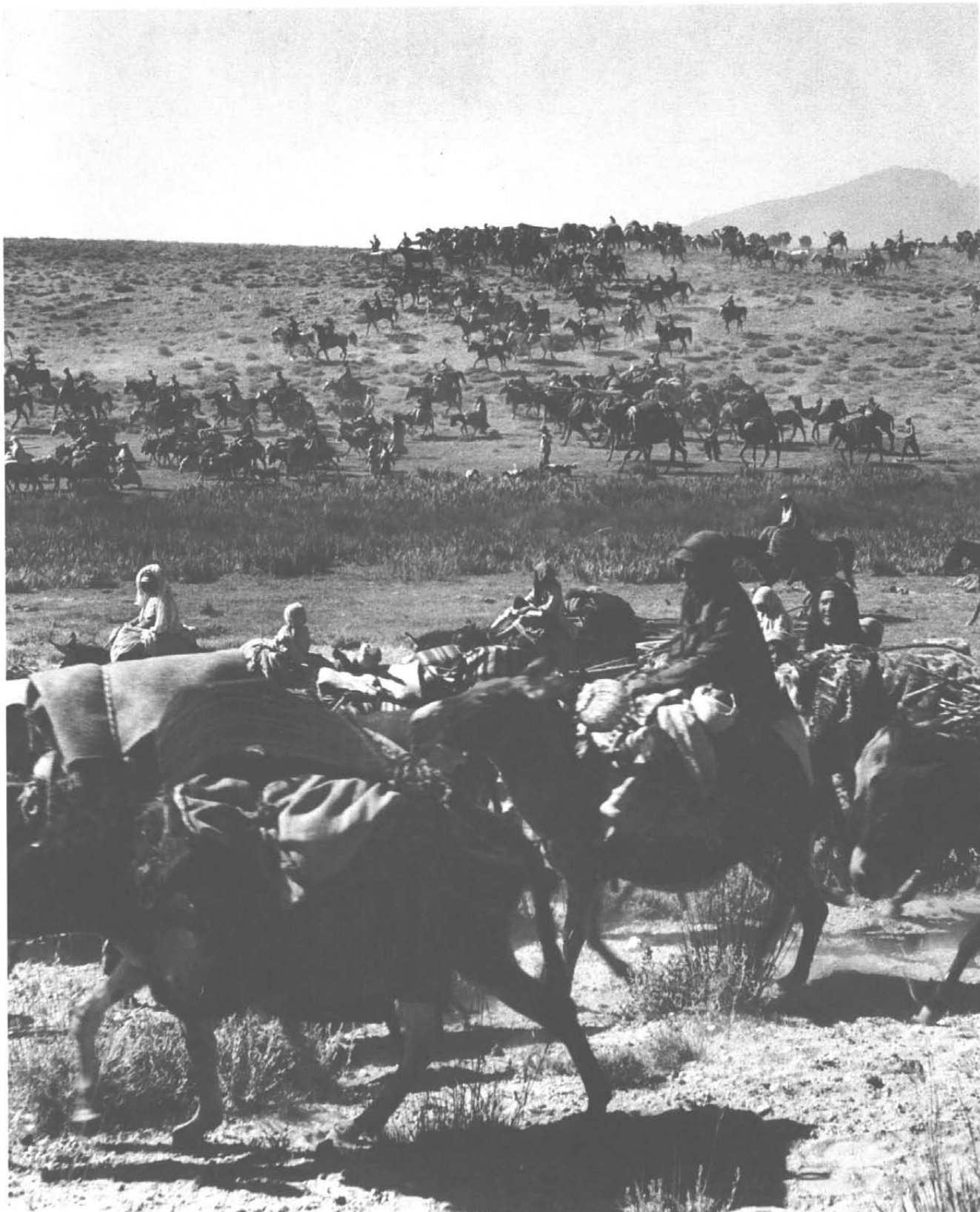
کوچ ایلات قشقای - تابستان ۱۹۴۶ میلادی