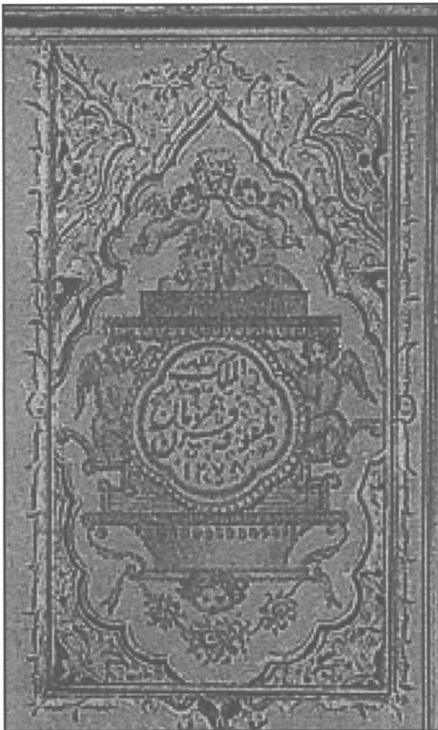
تصویر ۶- مهر ناصرالدین شاه قاجار

تاریخ ۱۰۳۴/ق. ۱۶۲۴م، سبک شیراز در صحنه‌ای از معراج، پیامبر سوار بر براق در وسط نگاره است و به شیری در قسمت چپ و بالای تصویر، خاتم نبوت را می‌دهد. (رابینسون، ۱۹۷۶، ص ۱۴۸). (تصویر ۷)