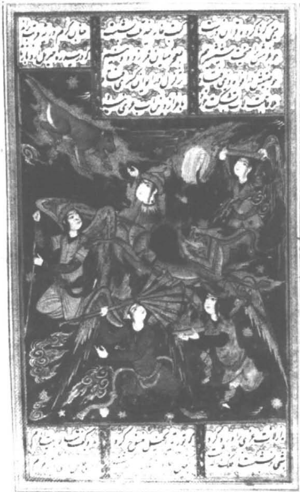
تصویر ۷- معراج پیامبر