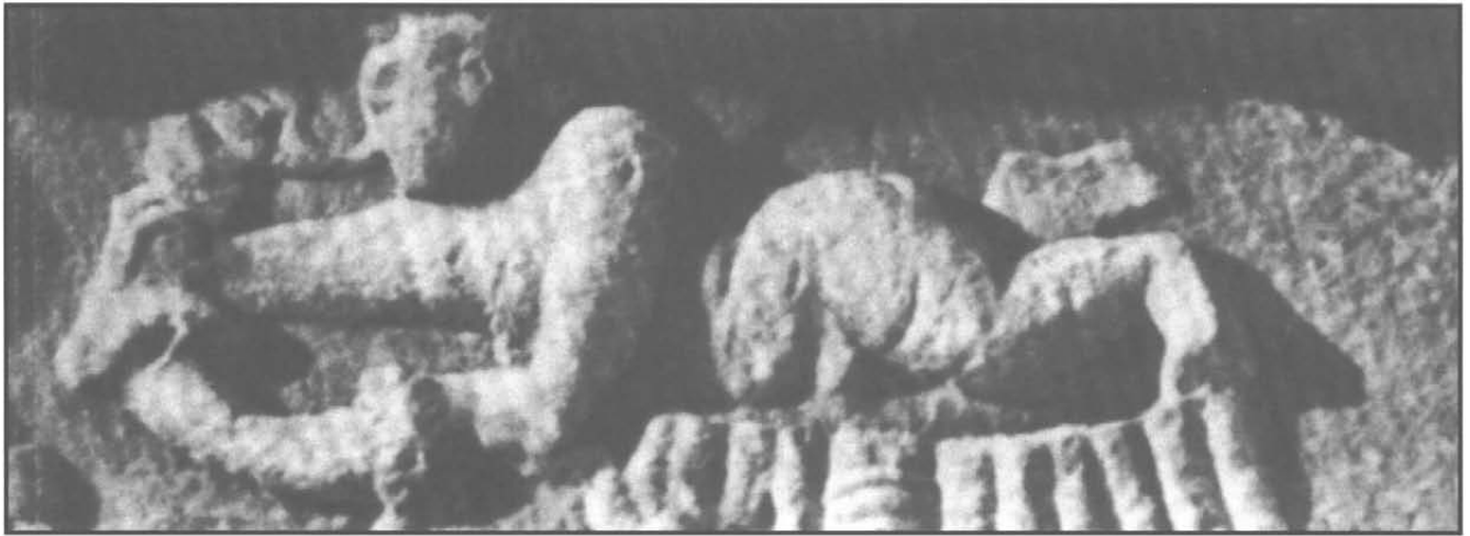
تصویر ۳ - بیشاپور - فرشته در حال دادن دیهیم به شاه

در هنر دوره قاجار، نماد دیو به کرات به کار رفته است و سمبل قدرت و شکوه سلطنتی است؛ بدین معنا که صاحب قدرت، توانسته حتی دیوان را شکست دهد و در زیر سلطه آورد.