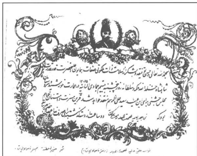
تصویر ۱- کارت دعوت از سوی منیر السلطنه برای عصمت الدوله دختر ناصرالین شاه قاجار به مناسبت میلاد حضرت فاطمه (س)

فرشته‌ای با چهار بال ایستاده و شیئی مقدس روی سر دارد که در واقع نماد نگاهیانی از مکان مقدس و حامل درخت مقدس می باشد.