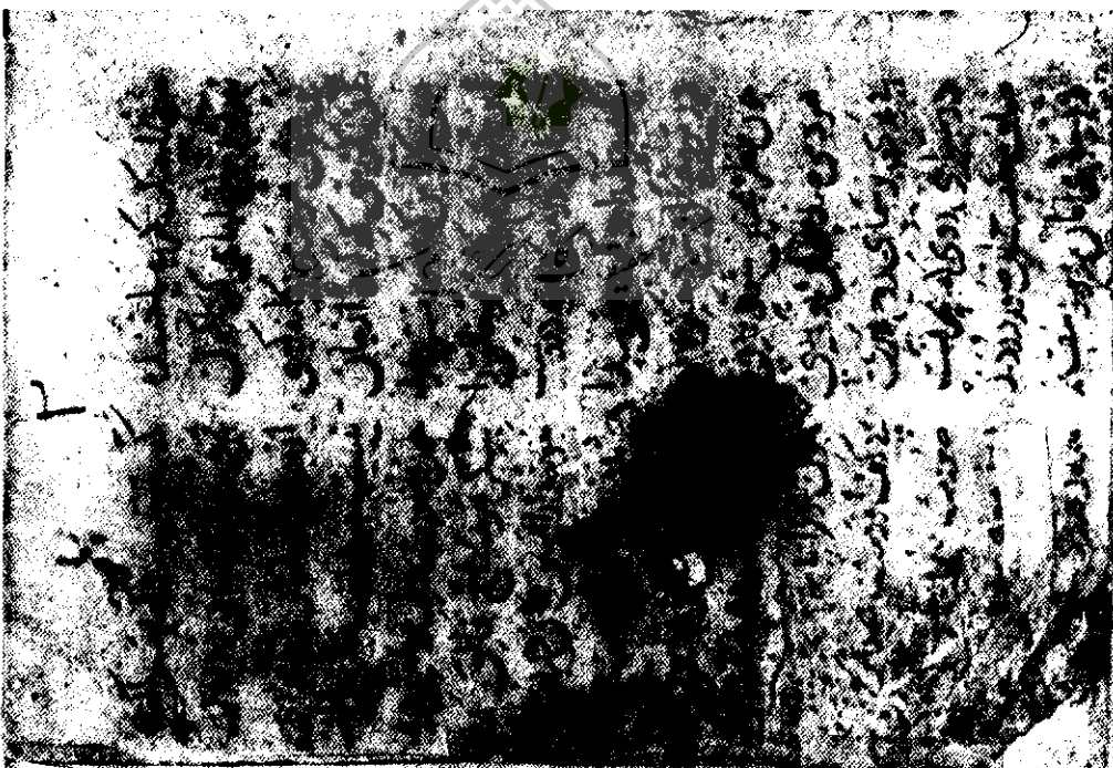
سازمان اسناد و کتابخانه ملی ایران، معاونت کتابخانه ملی، شماره نسخه خطی ۳۰۶۰/ف.