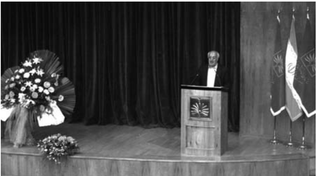
سخنرانی علی اکبر اشعری مشاور فرهنگی رئیس جمهور و رئیس سازمان اسناد و کتابخانه ملی ایران در روز اسناد ملی

تلاش و پیگیری دست‌اندرکاران آرشیو ملی برای نامگذاری روزی به نام روز اسناد ملی، از سال ۱۳۷۰ش. / ۱۹۹۱م. آغاز و در اواخر ۱۳۷۴ش. /