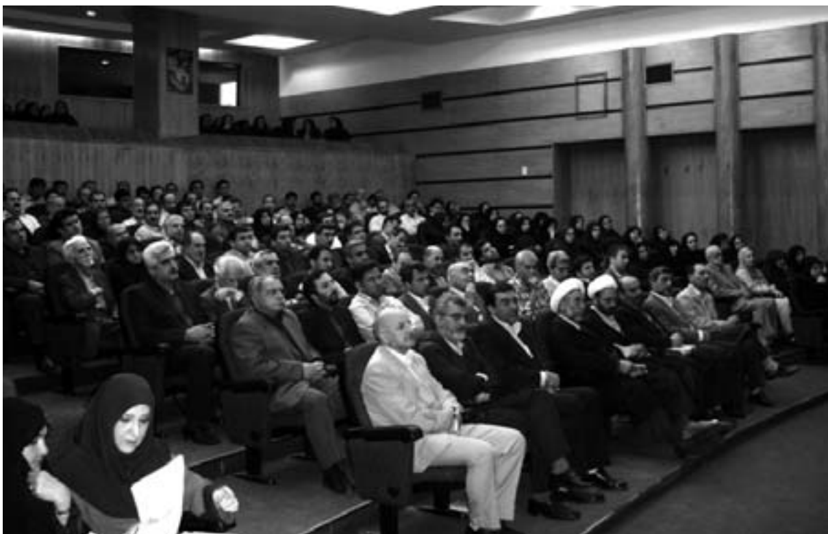
مراسم روز اسناد ملی (اردیبهشت ۱۳۸۷)

وبگاه سواربیکا، به زبان انگلیسی است و امید می‌رود در آینده نزدیک، به فارسی نیز بارگذاری شود. بخشهای مختلف این وبگاه، اهداف و وظایف و پیشینه کار و فعالیت این شعبه را معرفی می‌کند.