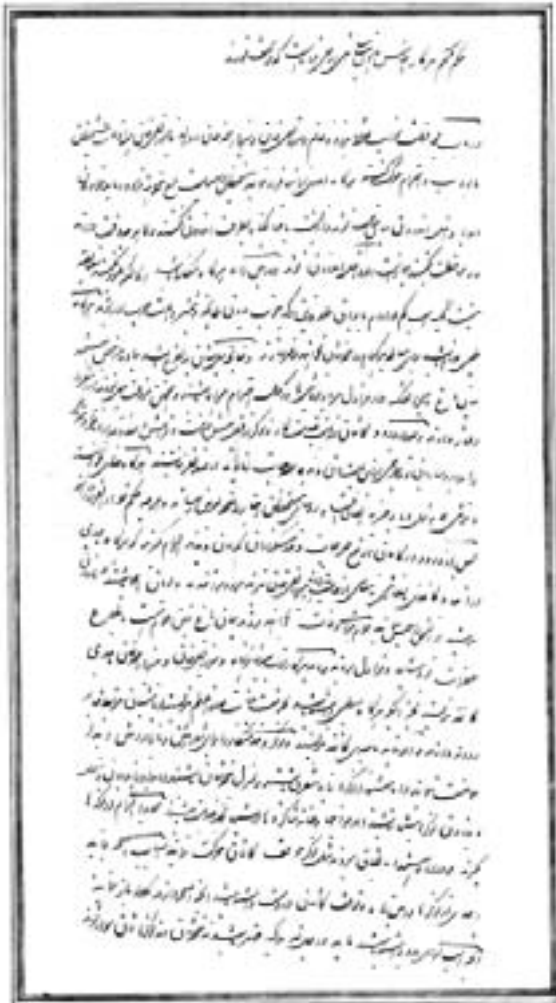
نمونه ای از اسناد آلبوم ۱۲۲

در نمایشگاه امسال، ۱۴ قبالة در معرض دید پژوهشگران قرار گرفت. قدیمی‌ترین آنها، از سال ۱۲۰۸ق. / ۱۷۹۳م. و جدیدترینشان مربوط به ۱۳۴۵ق. / ۱۹۲۶م. بود.