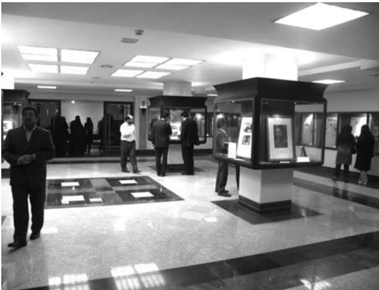
نمایشگاه روز اسناد ملی

برنامه‌های صبح سیمای جمهوری اسلامی ایران آغاز شد. با اغتنام فرصت، نکاتی درباب اهمیت اسناد، روشهای حفظ و نگهداری و مرمت آنها و شرح گزیده‌ای از فعالیتها و برنامه‌های سازمان، به اطلاع مردم رسید. سپس با برگزاری مراسم ویژه‌ای در ساختمان گنجینه ادامه یافت و با بازدید از نمایشگاه قباله‌های ازدواج و بخشهای جانبی آن، به پایان رسید. این برنامه‌ها، در هر یک از استانهای نیز که مدیریت منطقه‌ای سازمان برقرار است و فعالیتهای اسنادی در آن حوزه‌های جغرافیائی سامان می‌گیرد، تکرار شد. امید است در آینده نزدیک این پوشش استانی، به صورت فراگیر در تمامی استانهای کشور پی‌ریزی شود.