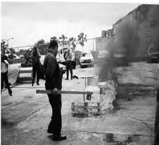
شکل ۲: بحران ناشی از آتش‌سوزی (در دست داشتن آئین‌نامه استانی برای پیشگیری از آتش و ایمنی، ضروری است). (ویلارد، ۲۰۰۵، ۱۷/۳)