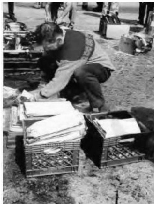
شکل ۳ و ۴: کتابخانه بوستون، در اثر حادثه سیل ۱۷ اوت ۱۹۹۸ (ویلارد، ۲۰۰۵، ۱۷/۴)