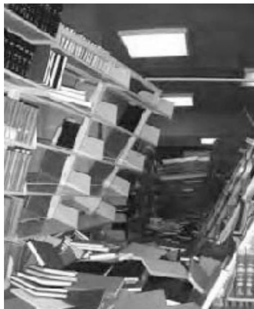
شکل ۱: بحران ناشی از زمین‌لرزه، ۲۸ فوریه ۲۰۰۱ در کتابخانه دانشگاه واشنگتن منجر به آسیب به ده‌ها هزار کتاب، در اثر سقوط آن‌ها شد. (ویلارد، ۲۰۰۵، ۱۷/۳)