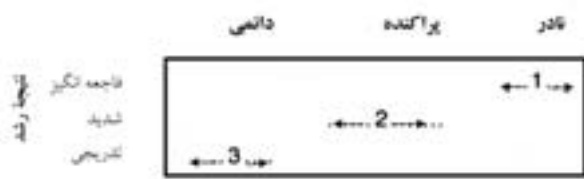
شکل ۹: فراوانی رخداد و شدت نتایج و تأثیرات آن‌ها بر آثار (والر، ۱۹۹۵، ص ۱۲)

به‌کارگیری برنامه مدیریت بحران در راهبردهای حفاظت پیشگیرانه، به کمک تکمیل و گسترش دسته‌بندی جامعی از عوامل آسیب‌رسان ممکن است. «دسته‌بندی ۹ عامل فیزیکی و یک عامل غیرفیزیکی (غفلت و بی‌توجهی) در