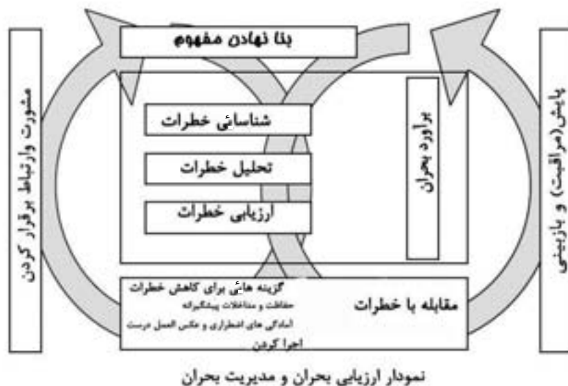
شکل ۵: نمودار مدیریت بحران و ارزیابی بحران (بروکرفوف، ۲۰۰۷، ص ۱۱۷) مطابق استاندارد استرالیا AS/NZS 4360: 2004