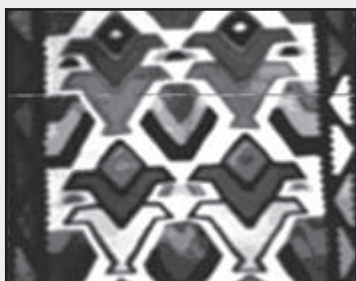
تصویر شماره ۳

در میان نقوش گلیم، نقش تخته‌ای، دارای زیبایی تجریدی منحصر به فردی است. نقوش تجریدی چون سیب، دوک، قرقره، بوته، آئینه و مانند این‌ها با نقوش لوزی و شش ضلعی