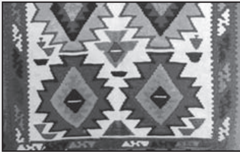
تصویر شماره ۵ قسمتی از گلیم با نقش آینه گل

از دیگر نقوش طبیعی - که مفهومی تجربیدی یافته - نقش شاخ بز است. این نقش، شباهت زیادی به سر بز با شاخ‌های تیزش دارد. نقش شاخ بز، از نقوش ابتکاری است و به صورت نادری بافته می‌شود. طرح مذکور، به گونه‌ای در کنار هم قرار گرفته است که اشکال لوزی و شش‌گوش را در فضاهای خالی مابین فضاهای منفی ایجاد کرده است و فضای کل گلیم را در طول و عرض با آن پر کرده است.