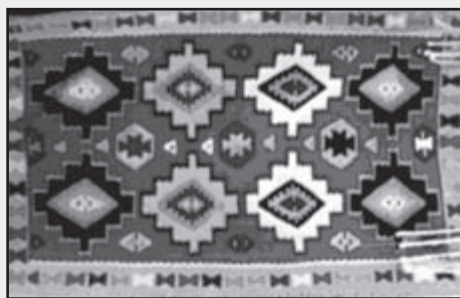
تصویر شماره ۴

در رنگ‌های متنوع بر پس زمینه‌ای رنگی، ترکیبی بسیار شاد و روحبخش ایجاد می‌کنند. در تصویر شماره ۴، قسمتی از گلیم را با نقش تخته‌ای بر زمینه‌ای قرمز رنگ می‌بینیم که شبیه تخته فرش است و آن را از حالت نقوش گلیم بیرون آورده است. شاید وجه تسمیه این نقش هم، از این جهت بوده باشد که گلیم را شبیه تخته فرش کرده است. از دیگر نقوش پرکاربرد، نقش راه‌راه است که به استادکار بافنده، این امکان را می‌دهد که از هر نقشینه‌ای که مایل باشد، در راه‌های آن بهره بگیرد. نوارهای پهن به ابعاد مختلف در رنگ‌ها و طرح‌های گوناگون که در هر چهار تا پنج راه تکرار می‌شود. این نقش،